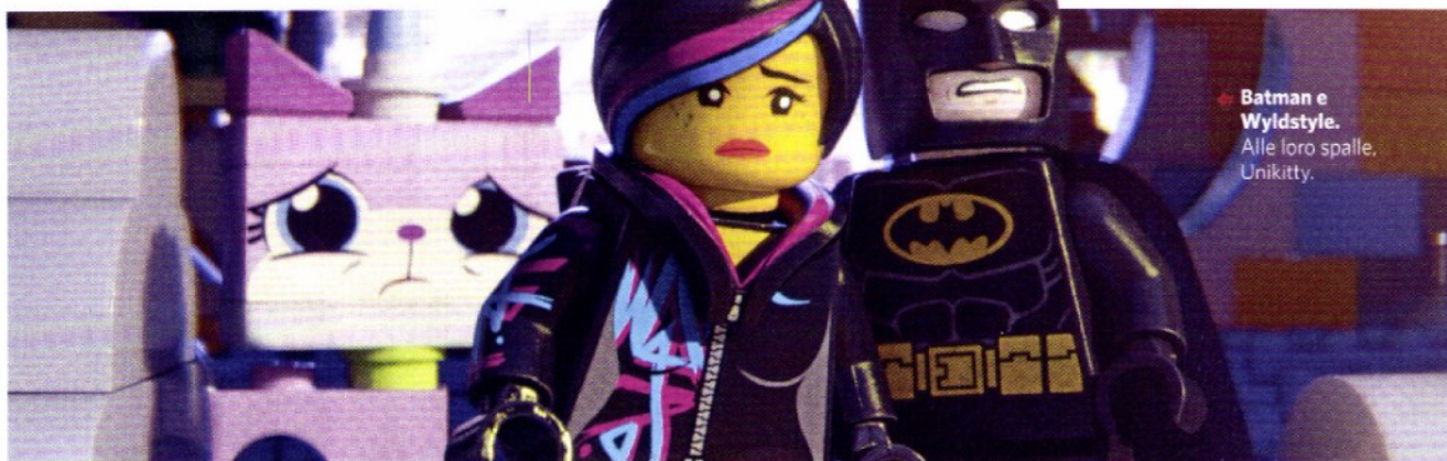
● Batman e Wyldstyle. Alle loro spalle, Unikitty.