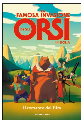
La famosa invasione degli orsi in Sicilia Il romanzo del film